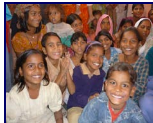
4ª SEMANA: CONFÍA