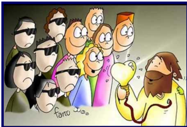
1ª SEMANA: ESPABILA