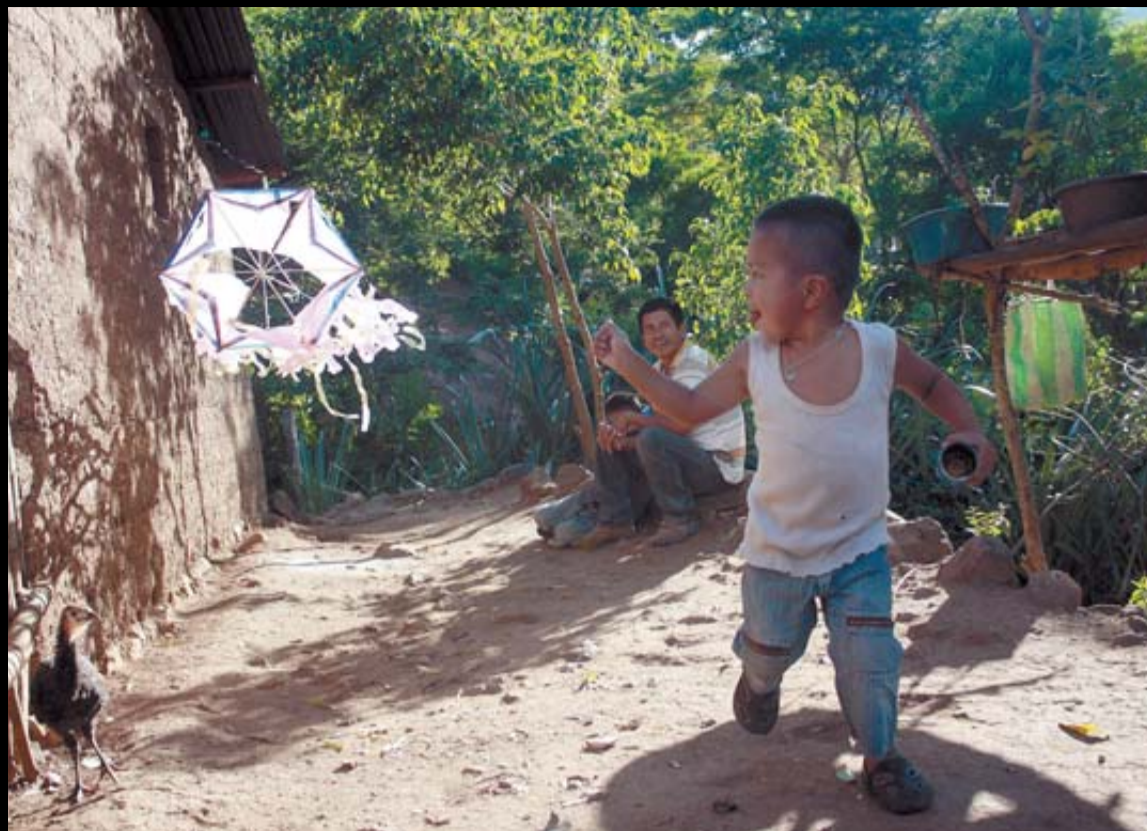
Un niño corre sonriente junto a un gallo con su cometa, en la comunidad de Morrito.