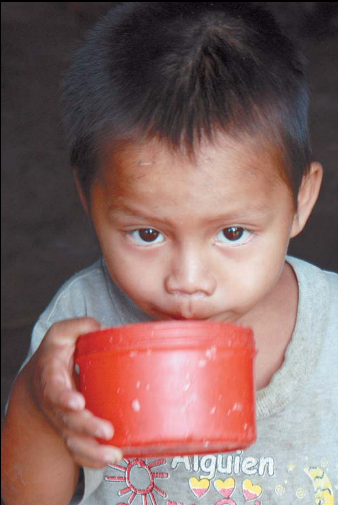
Un niño bebe un vaso de agua en un poblado de la región de Camotán.

DIARIO DE NAVARRA VIAJA CON MANOS UNIDAS AL PAÍS LATINO CON MAYOR ÍNDICE DE DESNUTRICIÓN CRÓNICA INFANTIL. UNO DE CADA DOS NIÑOS PASA HAMBRE MIENTRAS EL GOBIERNO MAQUILLA LAS ESTADÍSTICAS. TEXTOS Y FOTOS: GABRIEL GONZÁLEZ