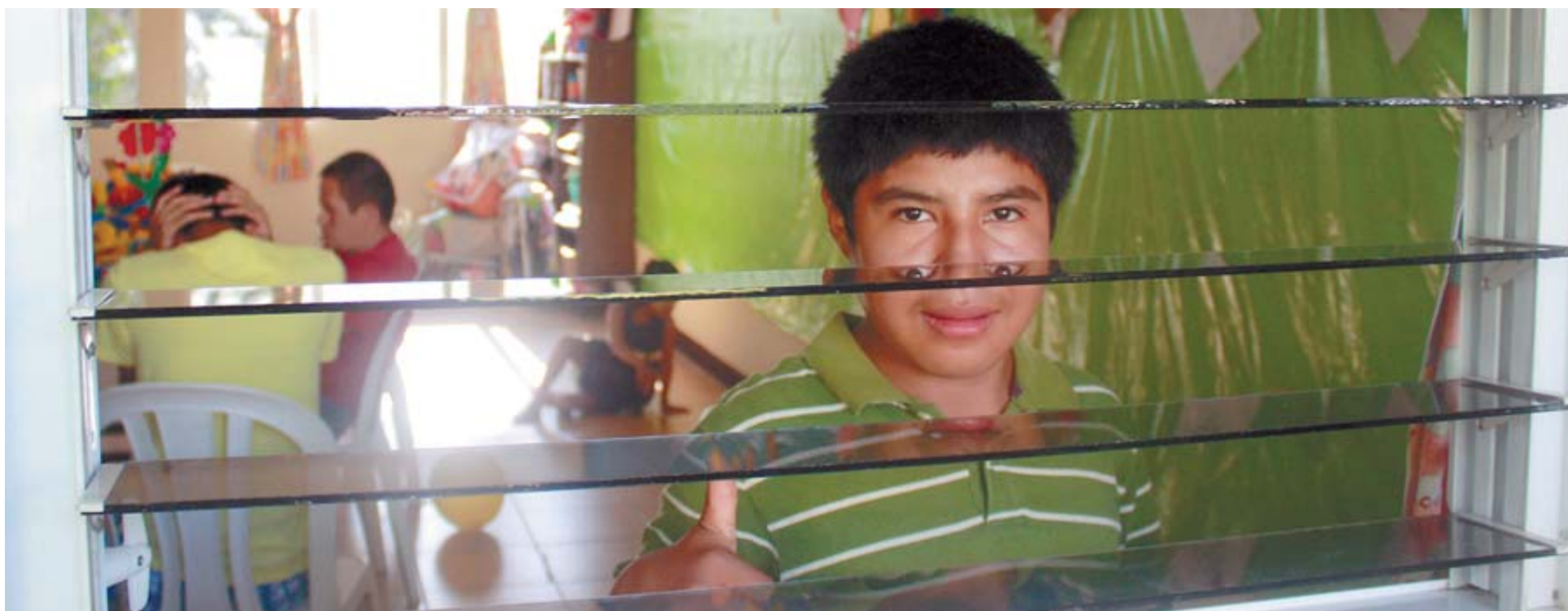
Uno de los niños con discapacidad internos en el centro de Paz y Bien levanta el dedo con optimismo, dentro de la sala donde se capacitan sus habilidades a través del juego.