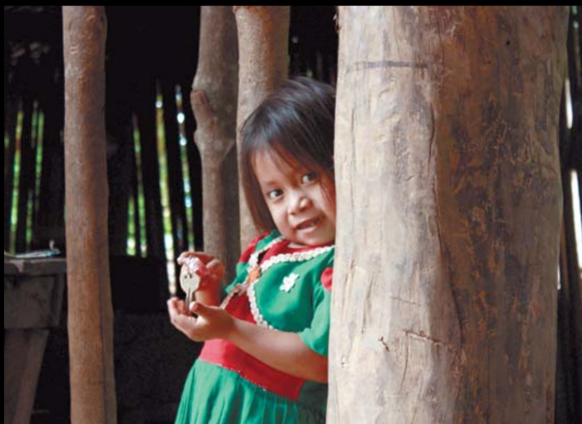
Una niña juega con unas llaves en una aldea de Camotán, donde las casas son chamizos de madera y hojas.

a este hospital subvencionado por Manos Unidas se limitaba a café, sal, limón y tortillas de maíz. Por eso llora de una forma tan aguda y sostenida que estremece, con el mal humor que caracteriza a los niños faltos de proteínas y calorías. Gracias a los esfuerzos por administrarle leche -la carne la rechaza-, logrará salir adelante, pero arrastrará las secuelas de por vida. “Los tres primeros años son fundamentales, y si el cerebro tiene un déficit de nutrientes durante ese tiempo va a sufrir un retraso toda su vida. Y abandonará la escuela, se casará con una chica igual que él y así se entra en un círculo vicioso que hay que romper”, resalta.