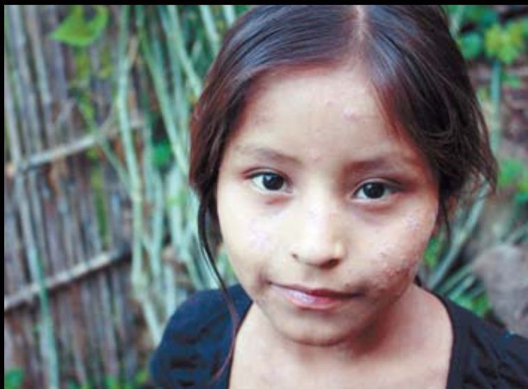
Uno de cada dos niños entre 0 y 5 años sufre desnutrición crónica.