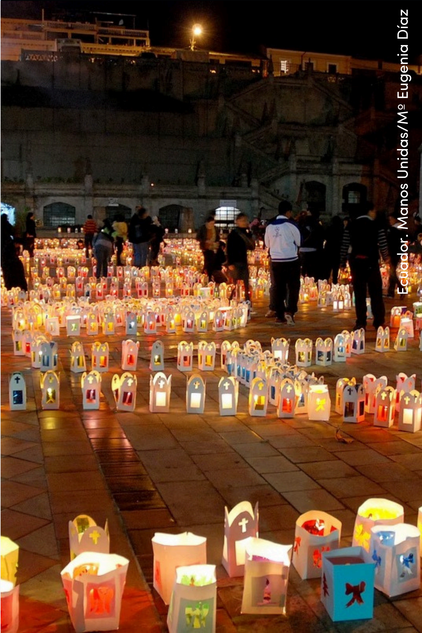
Ecuador. Manos Unidas/M.º Eugenia Díaz