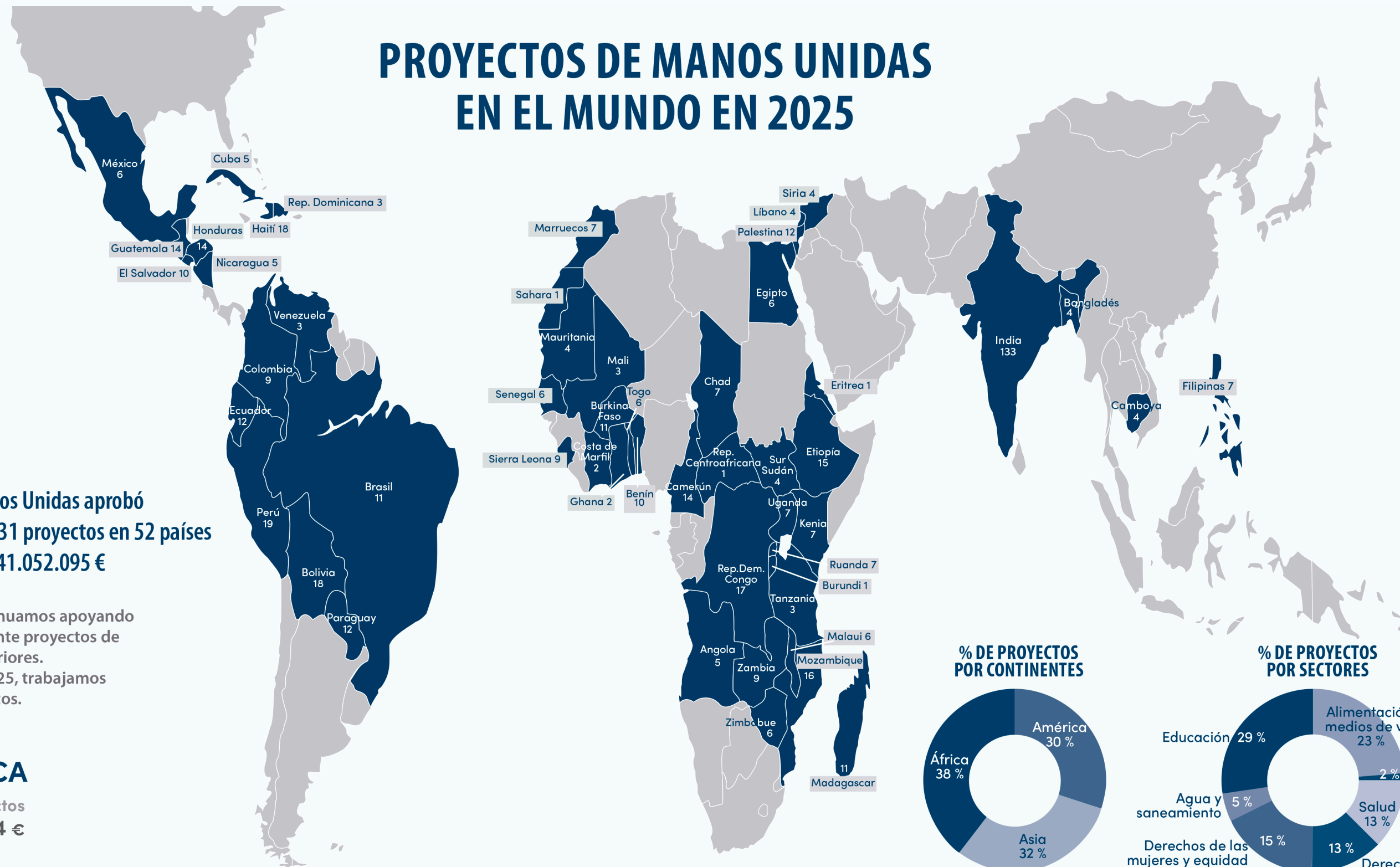
% DE PROYECTOS POR CONTINENTES