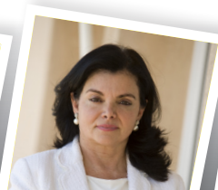
Carmen Peña López Presidenta de la Federación Internacional Farmacéutica.