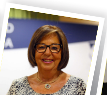
Adelaida de la Calle Rectora de la Universidad de Málaga.