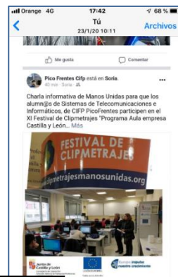
CIFP Pico Frentes