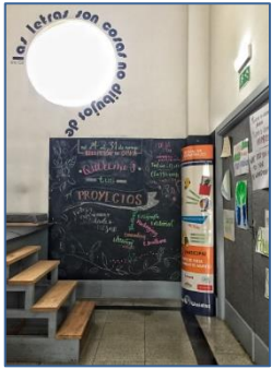
Escuela de Artes