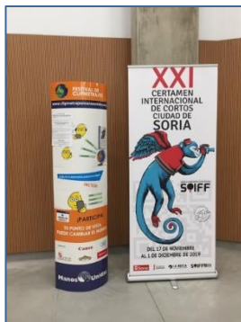
Cines Mercado – junto a Certamen de Cortos -