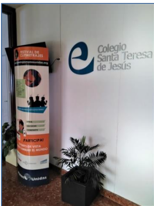
Colegio Santa Teresa de Jesús MM Escolapias