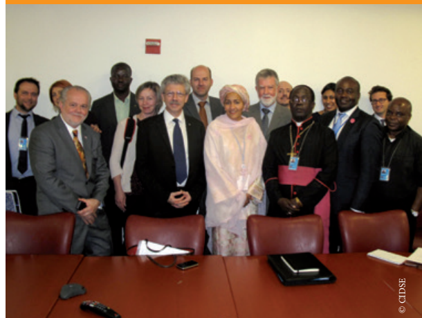
Delegados con Anima Mohammed, Consejera Especial de la ONU en la planificación del desarrollo del proceso post-2015

Una y otra vez, CIDSE ha subrayado que la dignidad humana y el respeto de los derechos humanos deben estar en el centro de los objetivos futuros. Además, deben abordar las estructuras de nuestro sistema financiero, así como el cambio climático. Nuestras delegaciones ante la ONU y la UE y nuestro trabajo en el Foro Social Mundial han servido para reforzar las voces de nuestras contrapartes del Sur y, actualmente, el “desarrollo sostenible” está en el centro de todas las áreas temáticas en las que trabajamos. El actual debate político nos presenta la oportunidad de promover nuestra visión sobre un nuevo marco post-2015 y los ODS, así como reforzar la conciencia cada vez mayor de que las cosas no pueden seguir como hasta ahora.