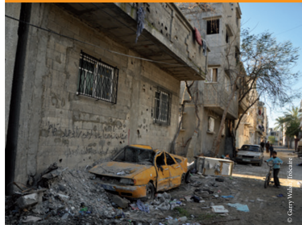
Gaza, área residencial afectada por los bombardeos aéreos de noviembre de 2012

Teniendo en cuenta el compromiso de promover el respeto del derecho internacional humanitario y las normas internacionales de derechos humanos, así como su influencia como uno de los donantes principales de los palestinos y socio comercial de Israel, son muchas las acciones que todavía puede realizar la UE para luchar contra las violaciones sobre el terreno.