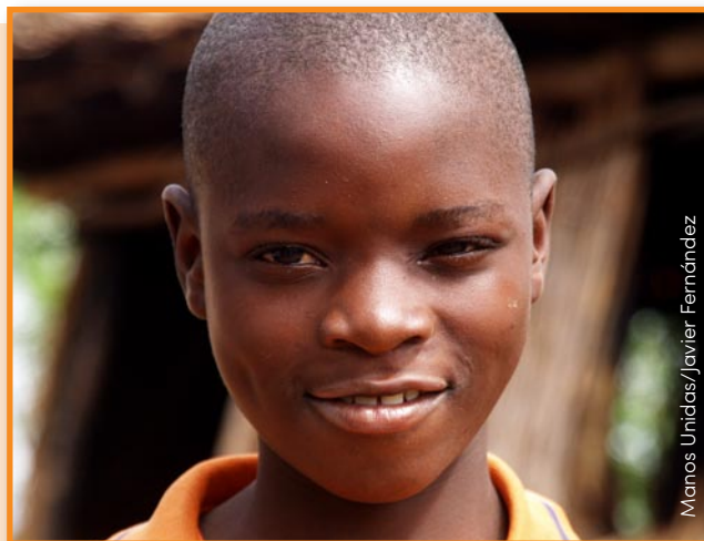
Manos Unidas/Javier Fernández

¿Colaboras con alguien que trabaje por los demás?