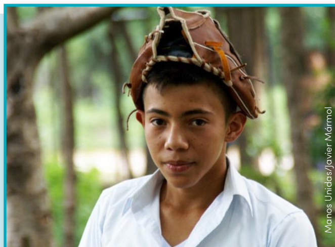
Manos Unidas/Javier Marmol