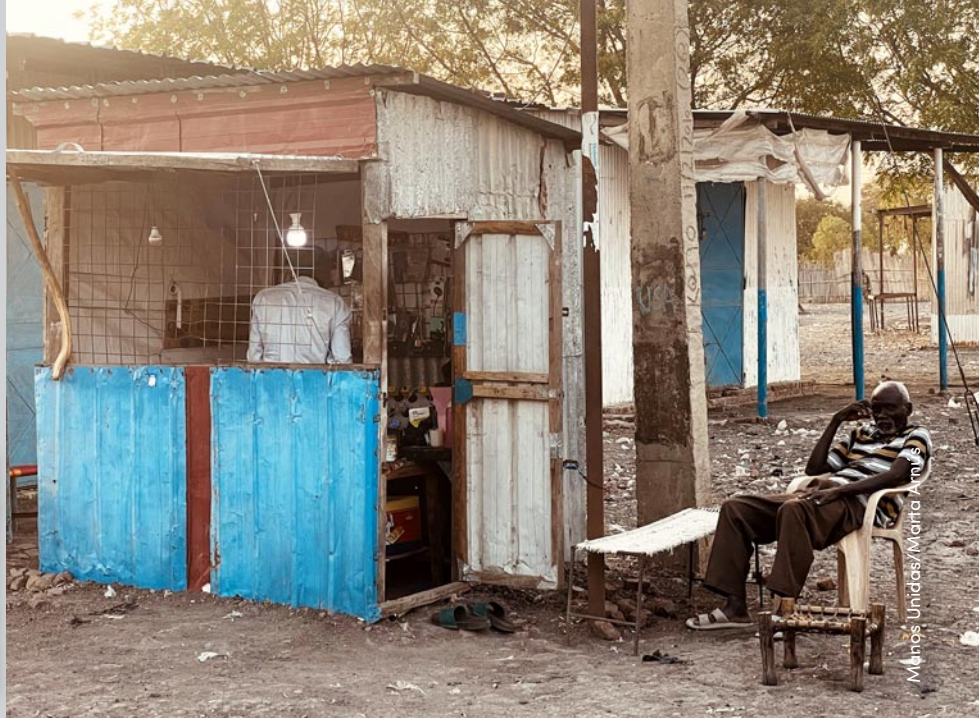
Menos Unidas/Marta Amis

inclusivo. Como dice su ministro de Información: «Las elecciones directas permiten que el pueblo, incluso los marginados, no sólo elija a sus dirigentes, sino que también les pida cuentas. Este alto nivel de rendición de cuentas impulsa la gobernanza y garantiza la paz y la estabilidad. Una gobernanza adecuada garantiza una distribución equitativa de los recursos, estimulando el desarrollo desde la base. A su vez, esto mejora las condiciones socioeconómicas de vida de la población y de la nación en su conjunto. Un impulso a la gobernanza y a las estructuras políticas y económicas también proporcionaría un apoyo muy necesario a los esfuerzos por combatir a la milicia Al Shabaab y dar paso a una nueva era de estabilidad. Pero ahora, como era de esperar, quienes se han beneficiado de las elecciones indirectas y de sus desigualdades durante décadas están indignados. Dicen que no puede funcionar, porque no quieren que funcione» (Daud Aweis Jama).