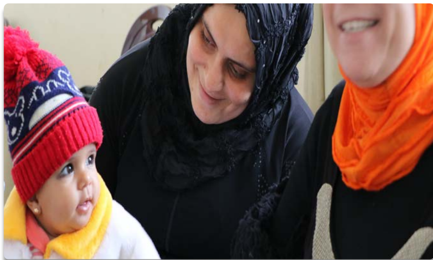
Estas mujeres han recobrado la esperanza gracias a los proyectos que les abren un camino en medio del sufrimiento.

“Al amanecer el primer día de la semana las mujeres se dirigían al sepulcro preguntándose: - ¿Quién nos retirará la piedra? Y entrando vieron a un joven sentado, vestido con una túnica blanca y se asustaron. - No os asustéis. ¿Buscáis a Jesús de Nazaret, el crucificado? Ha resucitado. No está aquí. Ved el lugar donde lo pusieron. Id a decir a sus, y a Pedro, que irá delante de vosotros a Galilea. Allí lo veréis.” (Mc 16,2-7)