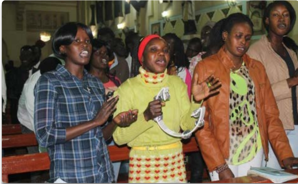
Mujeres eritreas atendidas en el Instituto Misionero Comboniano de El Cairo.

Lo seguía un gran gentío del pueblo, y de mujeres que se golpeaban el pecho y lanzaban lamentos por Él. (Lc. 23, 27)