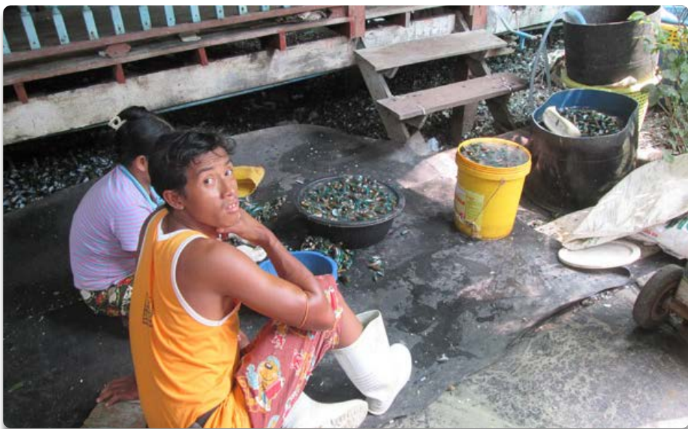
Los refugiados birmanos suelen trabajar en barcos pesqueros. Muchas veces desaparecen sin dejar rastro.

Él soportó nuestros sufrimientos y aguantó nuestros dolores... nuestro castigo saludable cayó sobre él, sus cicatrices nos curaron. (Is. 53, 4-5)